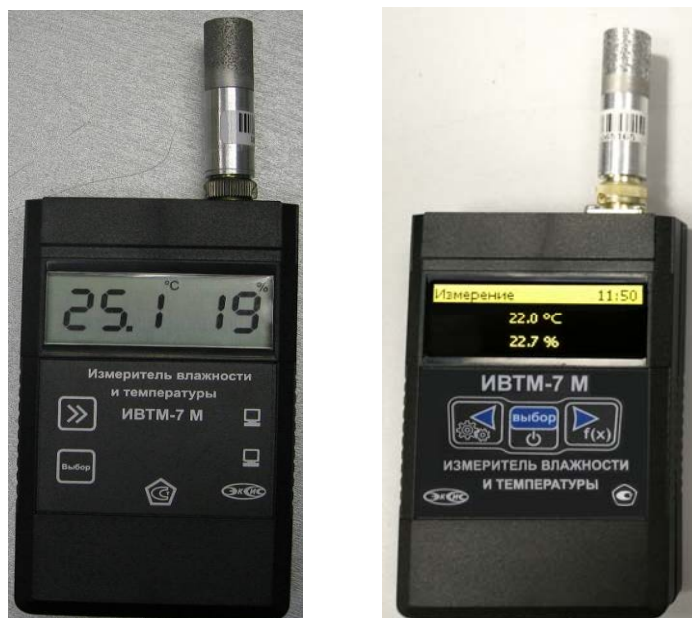
Рисунок 23 - Общий вид измерителя ИВТМ-7 М исполнения ИВТМ-7 М 3 с интерфейсами RS-485 (слева) и Ethernet (справа)