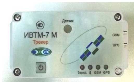
Рисунок 36 - Общий вид измерителя ИВТМ-7 М исполнения ИВТМ-7 М ТР-3