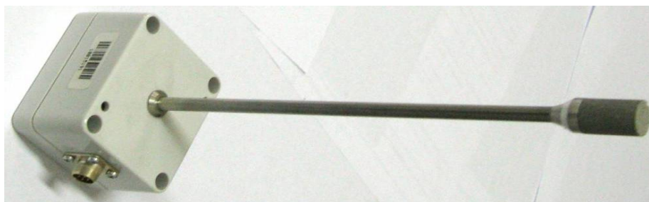
Рисунок 55 - Измерительный преобразователь ИПВТ-03-14