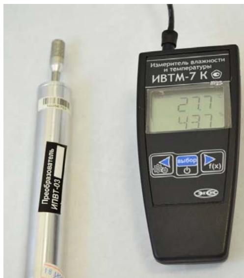
Рисунок 18 - Общий вид измерителя ИВТМ-7 К исполнение ИВТМ-7 К-1