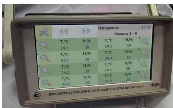
а) исполнение ИВТМ-7 /16-Т