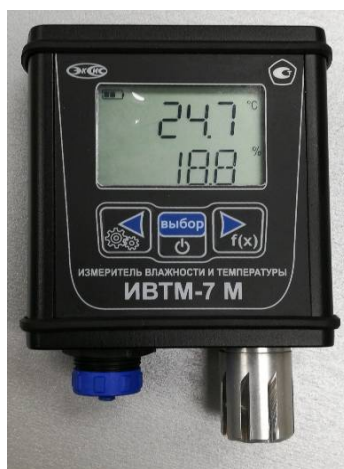
Рисунок 22 - Общий вид измерителя ИВТМ-7 М исполнения ИВТМ-7 М 2-В