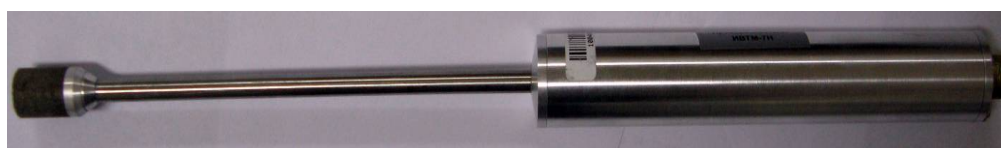
Рисунок 3 - Общий вид измерителя ИВТМ-7 Н исполнения ИВТМ-7 Н-04