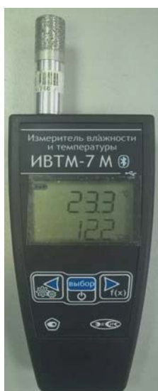
Рисунок 31 - Общий вид измерителя ИВТМ-7 М исполнения ИВТМ-7 М 7-1