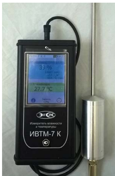
Рисунок 19 - Общий вид измерителя ИВТМ-7 К исполнение ИВТМ-7 К-Т