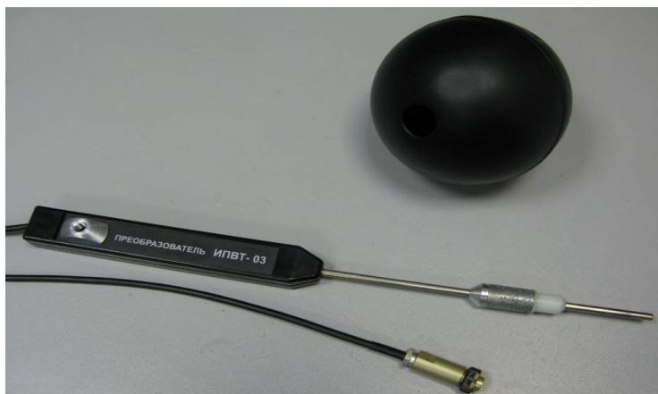
Рисунок 51 - Измерительный преобразователь ИПВТ-03-09