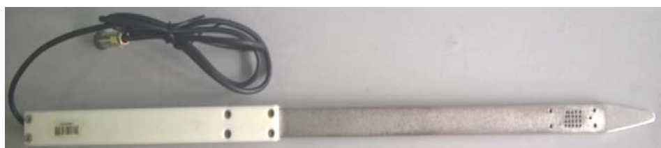
Рисунок 9 - Общий вид измерителя ИВТМ-7 Н исполнения ИВТМ-7 Н-11