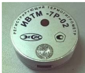
Рисунок 14 - Общий вид измерителя ИВТМ-7 Р исполнения ИВТМ-7 Р-02