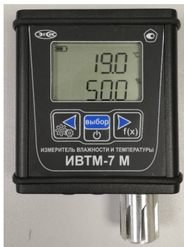
Рисунок 24 - Общий вид измерителя ИВТМ-7 М исполнения ИВТМ-7 М 3-В