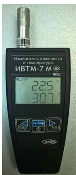
Рисунок 29 - Общий вид измерителя ИВТМ-7 М исполнения ИВТМ-7 М 6-1