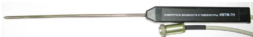
Рисунок 4 - Общий вид измерителя ИВТМ-7 Н исполнения ИВТМ-7 Н-05