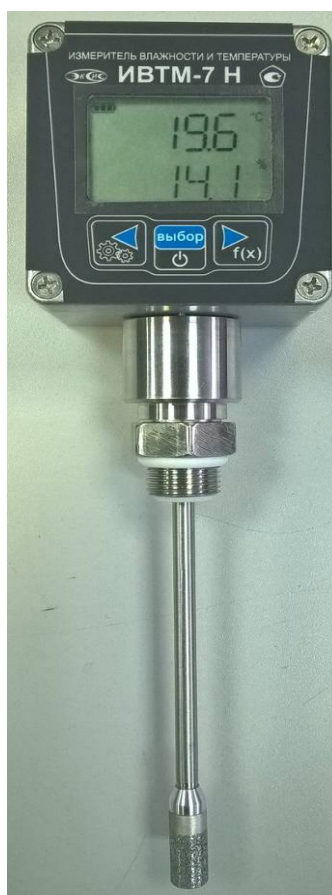
Рисунок 6 - Общий вид измерителя ИВТМ-7 Н исполнения ИВТМ-7 Н-И-06