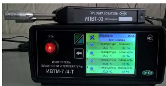
в) исполнение ИВТМ-7 /4-Т