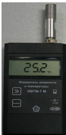
Рисунок 20 - Общий вид измерителя ИВТМ-7 М исполнения ИВТМ-7 М 1