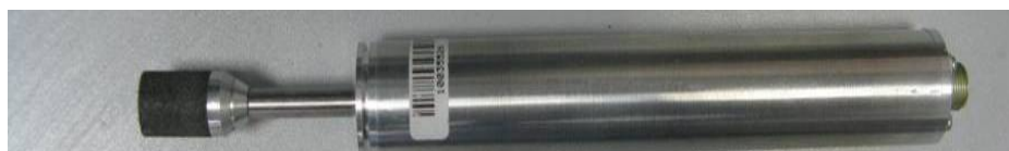
Рисунок 11 - Общий вид измерителя ИВТМ-7 Н исполнения ИВТМ-7 Н-13