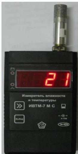
Рисунок 33 - Общий вид измерителя ИВТМ-7 М исполнения ИВТМ-7 М С