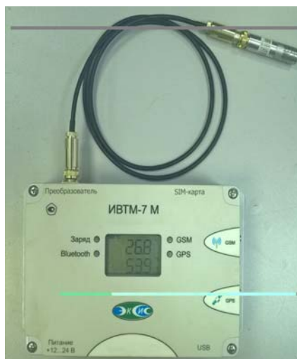
Рисунок 34 - Общий вид измерителя ИВТМ-7 М исполнения ИВТМ-7 М ТР-1