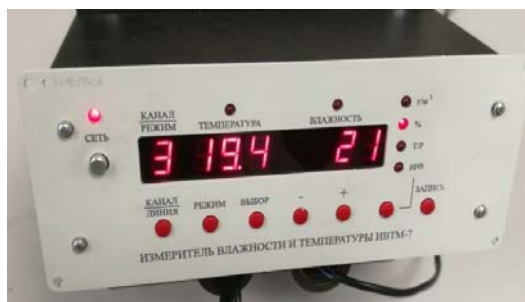
исполнения ИВТМ-7 /3-С