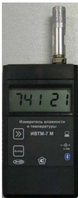
Рисунок 30 - Общий вид измерителя ИВТМ-7 М исполнения ИВТМ-7 М 7