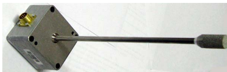
Рисунок 12 - Общий вид измерителя ИВТМ-7 Н исполнения ИВТМ-7 Н-14