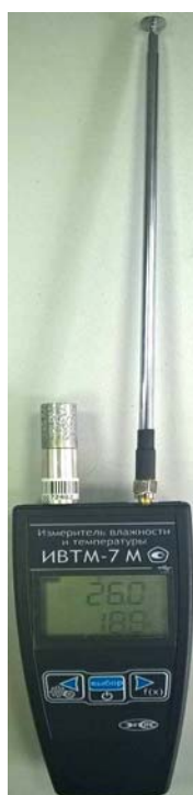
Рисунок 26 - Общий вид измерителя ИВТМ-7 М исполнения ИВТМ-7 М 4-1