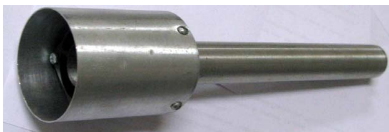
Рисунок 7 - Общий вид измерителя ИВТМ-7 Н исполнения ИВТМ-7 Н-07