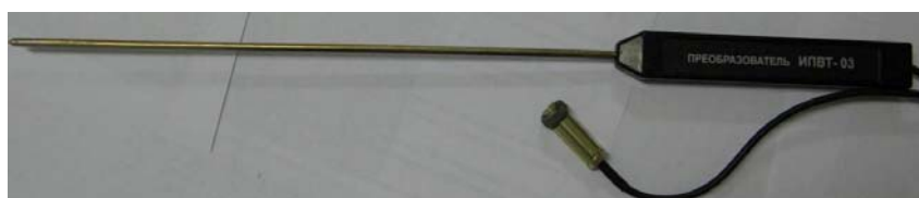
Рисунок 48 - Измерительный преобразователь ИПВТ-03-05