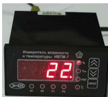
Рисунок 39 - Общий вид измерителя ИВТМ-7 /Х исполнения ИВТМ-7 /Х-Щ