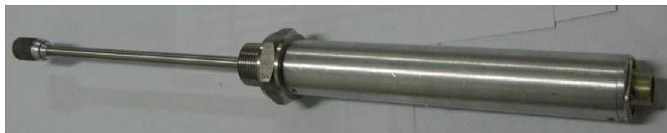
Рисунок 5 - Общий вид измерителя ИВТМ-7 Н исполнения ИВТМ-7 Н-06