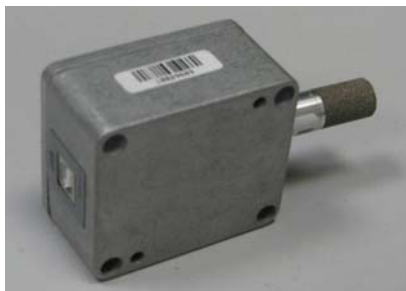
Рисунок 13 - Общий вид измерителя ИВТМ-7 Р исполнения ИВТМ-7 Р-01