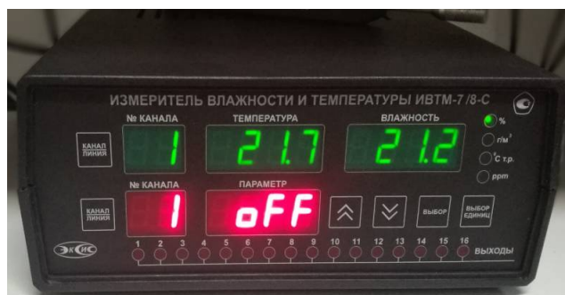
исполнения ИВТМ-7 /8-С