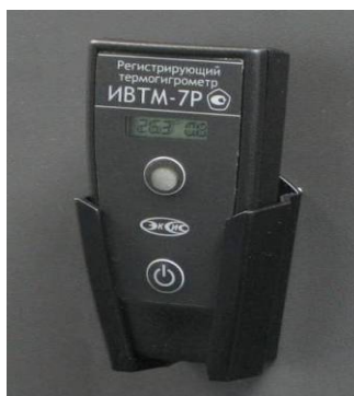
Рисунок 16 - Общий вид измерителя ИВТМ-7 Р исполнения ИВТМ-7 Р-03