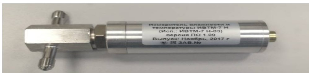
Рисунок 2 - Общий вид измерителя ИВТМ-7 Н исполнения ИВТМ-7 Н-03