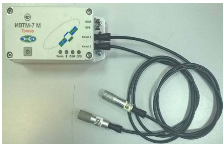
Рисунок 38 - Общий вид измерителя ИВТМ-7 М исполнения ИВТМ-7 М ТР-5