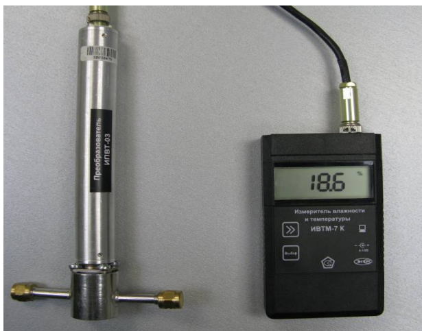
Рисунок 17 - Общий вид измерителя ИВТМ-7 К