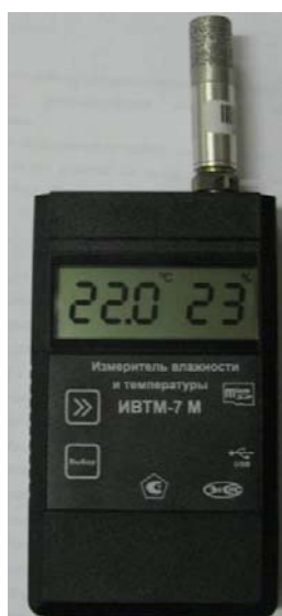
Рисунок 28 - Общий вид измерителя ИВТМ-7 М исполнения ИВТМ-7 М 6