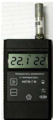
Рисунок 27 - Общий вид измерителя ИВТМ-7 М исполнения ИВТМ-7 М 5