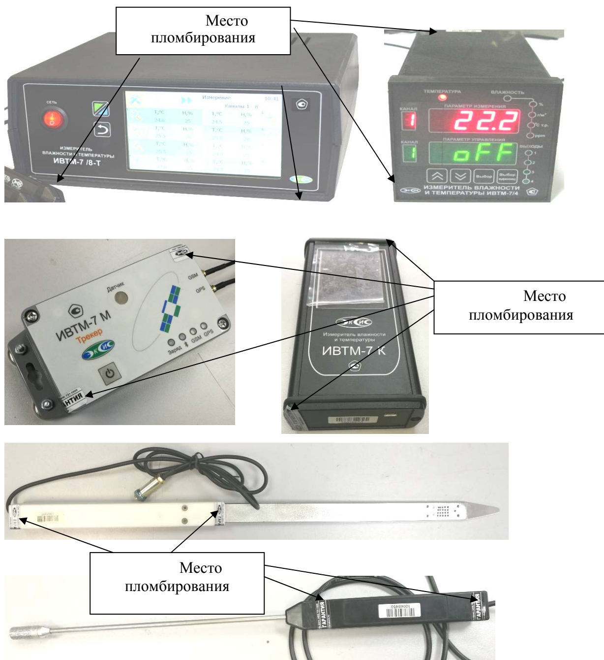
Рисунок 56 - Схема пломбирования измерителей от несанкционированного доступа (Стрелками указаны места пломбирования от несанкционированного доступа)