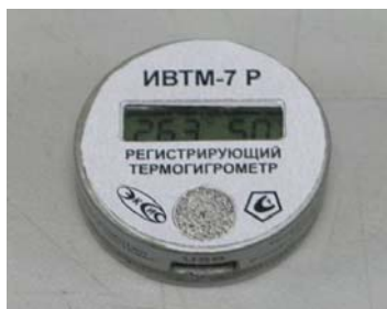
Рисунок 15 - Общий вид измерителя ИВТМ-7 Р исполнения ИВТМ-7 Р-02-И