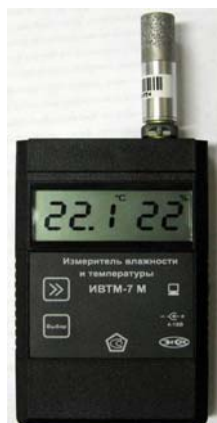
Рисунок 21 - Общий вид измерителя ИВТМ-7 М исполнения ИВТМ-7 М 2