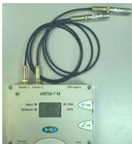
Рисунок 35 - Общий вид измерителя ИВТМ-7 М исполнения ИВТМ-7 М ТР-2