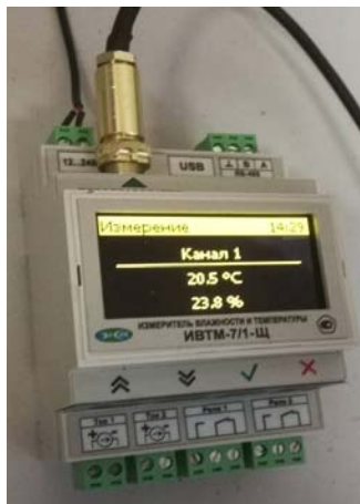
Рисунок 40 - Общий вид измерителя ИВТМ-7 /X исполнения ИВТМ-7 /X-Щ-Д