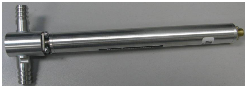
Рисунок 46 - Измерительный преобразователь ИПВТ-03-03