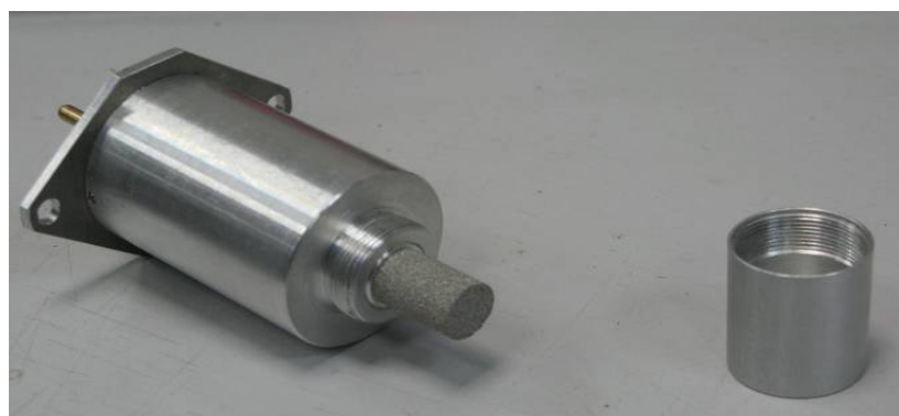
Рисунок 10 - Общий вид измерителя ИВТМ-7 Н исполнения ИВТМ-7 Н-12