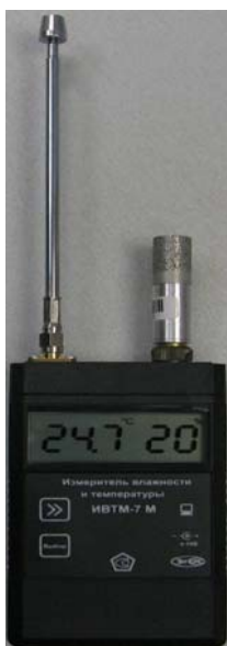
Рисунок 25 - Общий вид измерителя ИВТМ-7 М исполнения ИВТМ-7 М 4