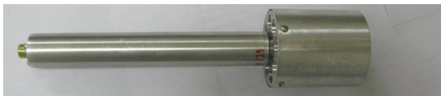
Рисунок 50 - Измерительный преобразователь ИПВТ-03-07