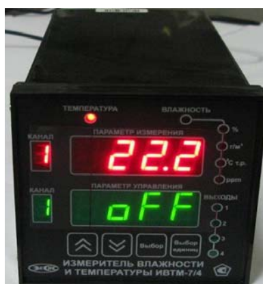
Рисунок 41 - Общий вид измерителя ИВТМ-7 /X исполнения ИВТМ-7 /X-Щ2