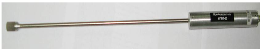
Рисунок 47 - Измерительный преобразователь ИПВТ-03-04