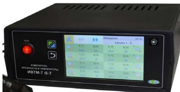
б) исполнение ИВТМ-7 /8-Т