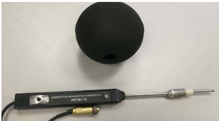
Рисунок 8 - Общий вид измерителя ИВТМ-7 Н исполнения ИВТМ-7 Н-09