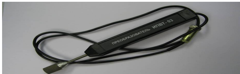
Рисунок 44 - Измерительный преобразователь ИПВТ-03-01