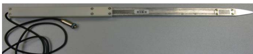
Рисунок 52 - Измерительный преобразователь ИПВТ-03-11