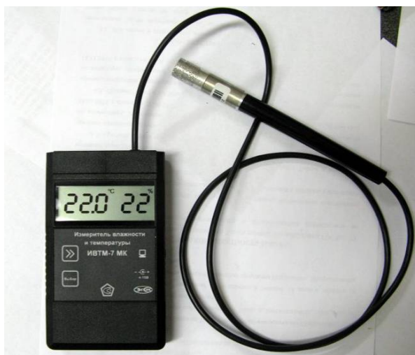
Рисунок 32 - Общий вид измерителя ИВТМ-7 М исполнения ИВТМ-7 М К