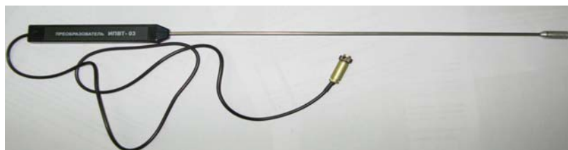
Рисунок 45 - Измерительный преобразователь ИПВТ-03-02