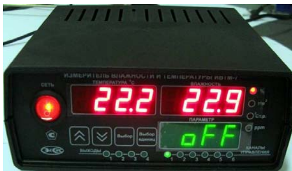
исполнения ИВТМ-7 /1-С