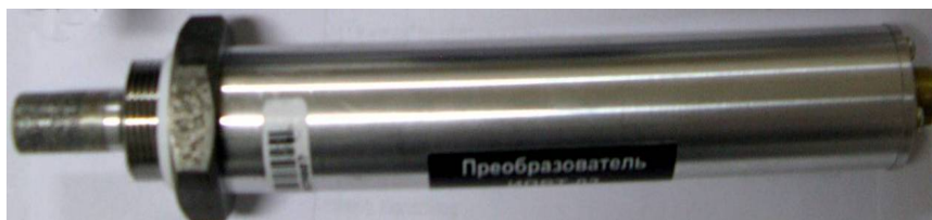
Рисунок 49 - Измерительный преобразователь ИПВТ-03-06